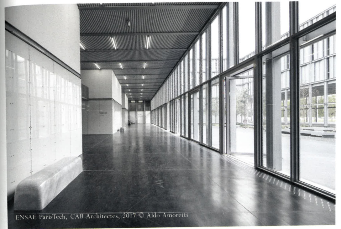
ENSAE ParisTech, CAB Architectes, 2017