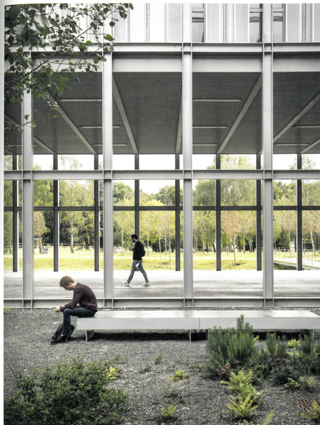
ENSAE ParisTech, CAB Architectes, 2017 © Aldo Amoretti

Projeté par l'agence CAB, ce programme se démarque par sa simplicité et sa compacité. Il a été pensé comme une figure hybride, souple et potentiellement évolutive. Cette configuration offre les conditions propices à la fois aux échanges, à la convivialité mais aussi à la concentration et au travail. Les 875 étudiants et 340 enseignants-chercheurs profitent de deux amphithéâtres et de la cafétéria donnant sur un patio végétalisé. Le bâtiment s'ouvre, grâce à ses rez-de-chaussée à double hauteur et son porche sur le green, espace public majeur du quartier.